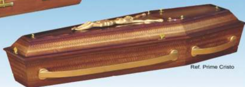
Ref. Prime Cristo

Rua Vila Nova, 765 CEP-18530-000 Tietê - SP - Fone/Fax: (15) 32821998 Contato: vendas@faurtil.com.br Website: www.faurtil.com.br