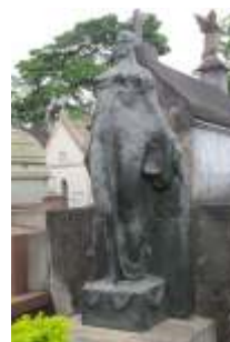
Musa Bronze Túmulo em 2007