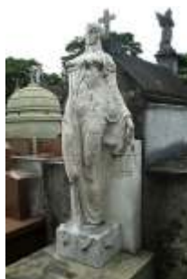
Musa Mármore Túmulo até 2006

Victor Brecheret nasceu em 1894, não se sabe ao certo se na Itália ou no Brasil. Considerado um dos mais importantes escultores do Brasil, foi o responsável pela introdução do modernismo na escultura. Na Semana de Arte Moderna de 1922 expôs nada menos que 22 obras. Era tímido, quieto e vivia mais isolado, o que se refletiu numa grande produção artística. Em sua vida desenvolveu diferentes trabalhos, inserindo-se em diferentes cenários culturais no Brasil e na Europa. Além da Musa Impassível, Brecheret tem outras obras tumulares e destacou-se por seus trabalhos expostos a céu aberto, como o famoso Monumento às Bandeiras, que enfeita o Parque Ibirapuera em São Paulo.