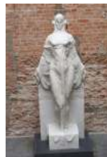
Musa Mármore Pinacoteca hoje